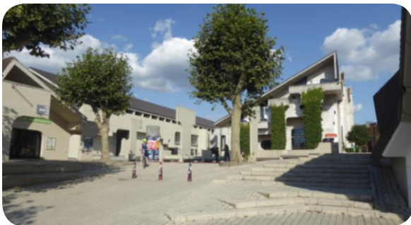
De voormalige Bibliotheek van Louvain-la-Neuve, thans L-museum