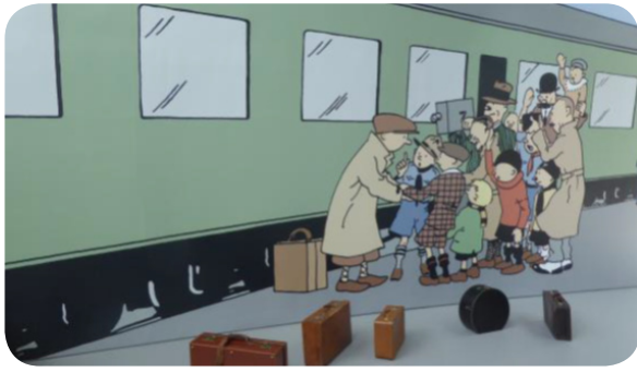
Hergé museum (2009) in Louvain-la-Neuve